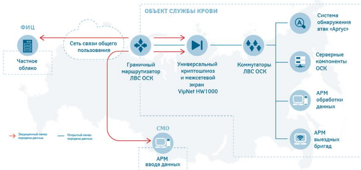
Рисунок 3 - Типовая схема объекта ЕИБД (РИЦ, СПК/ОПК)